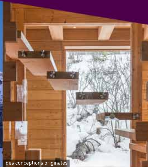
des conceptions originales