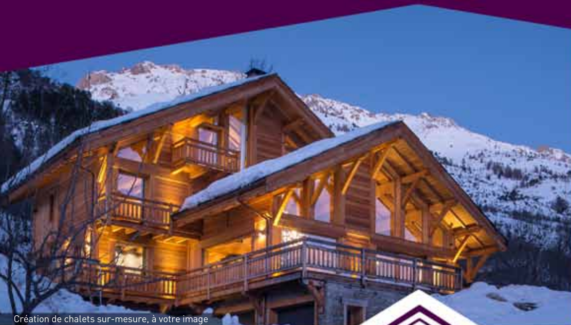
Création de chalets sur-mesure, à votre image