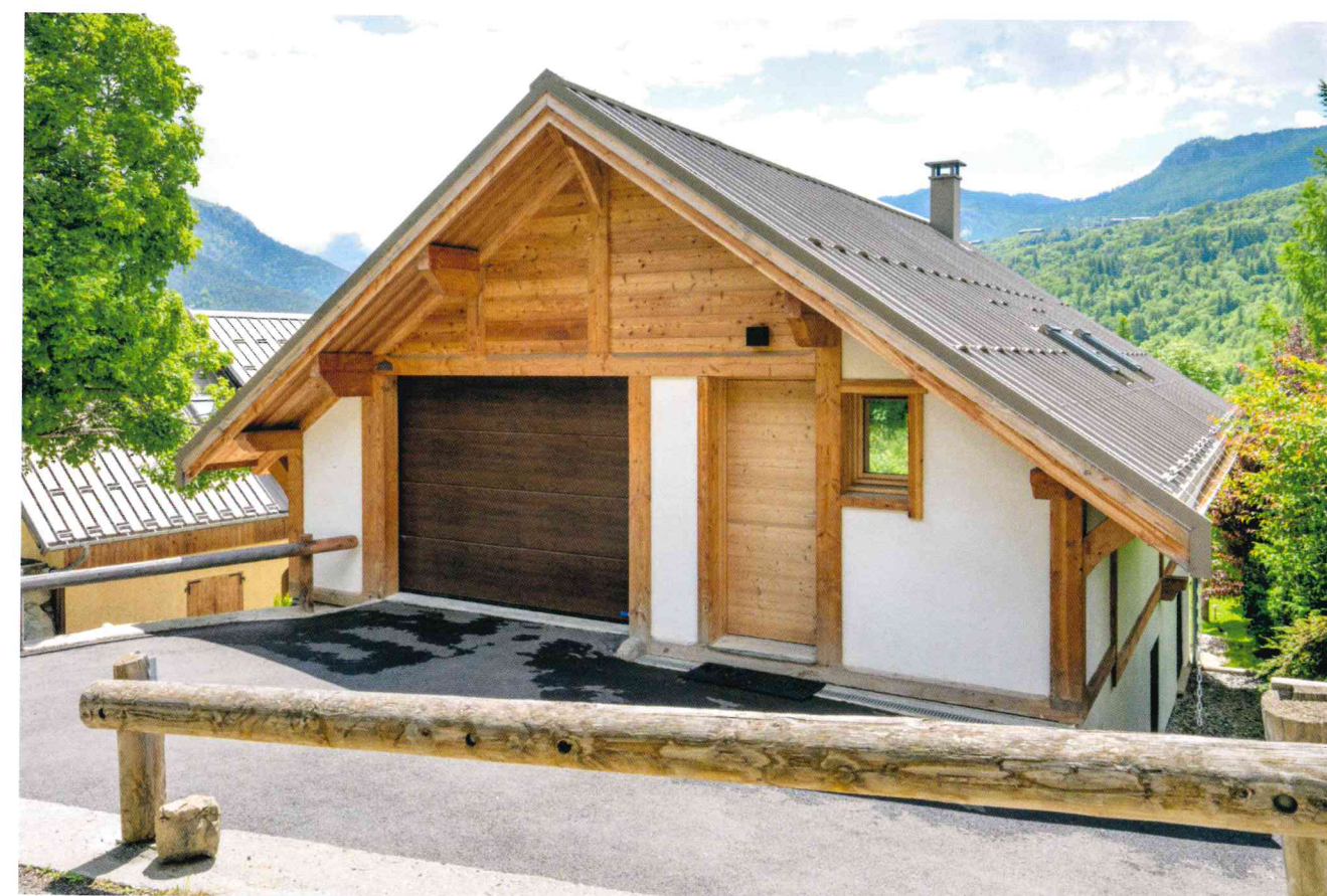
Ci-dessus : Le Douglas utilisé pour la structure poteaux-poutres apporte une esthétique naturelle et chaleureuse, en parfaite adéquation avec le cadre alpin du Briançonnais.