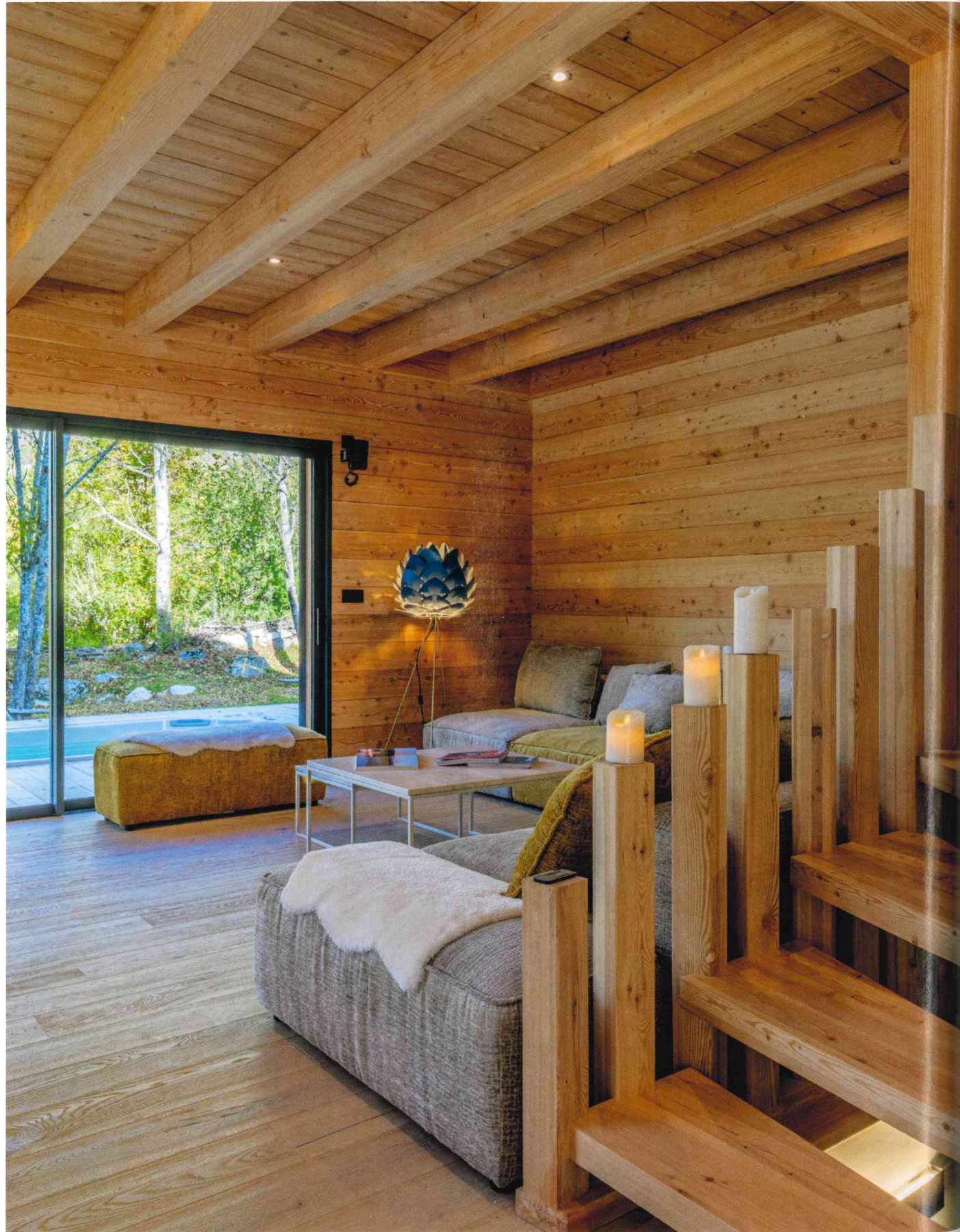
Ci-dessus : L'escalier en bois sur mesure relie harmonieusement les différents niveaux de la maison.