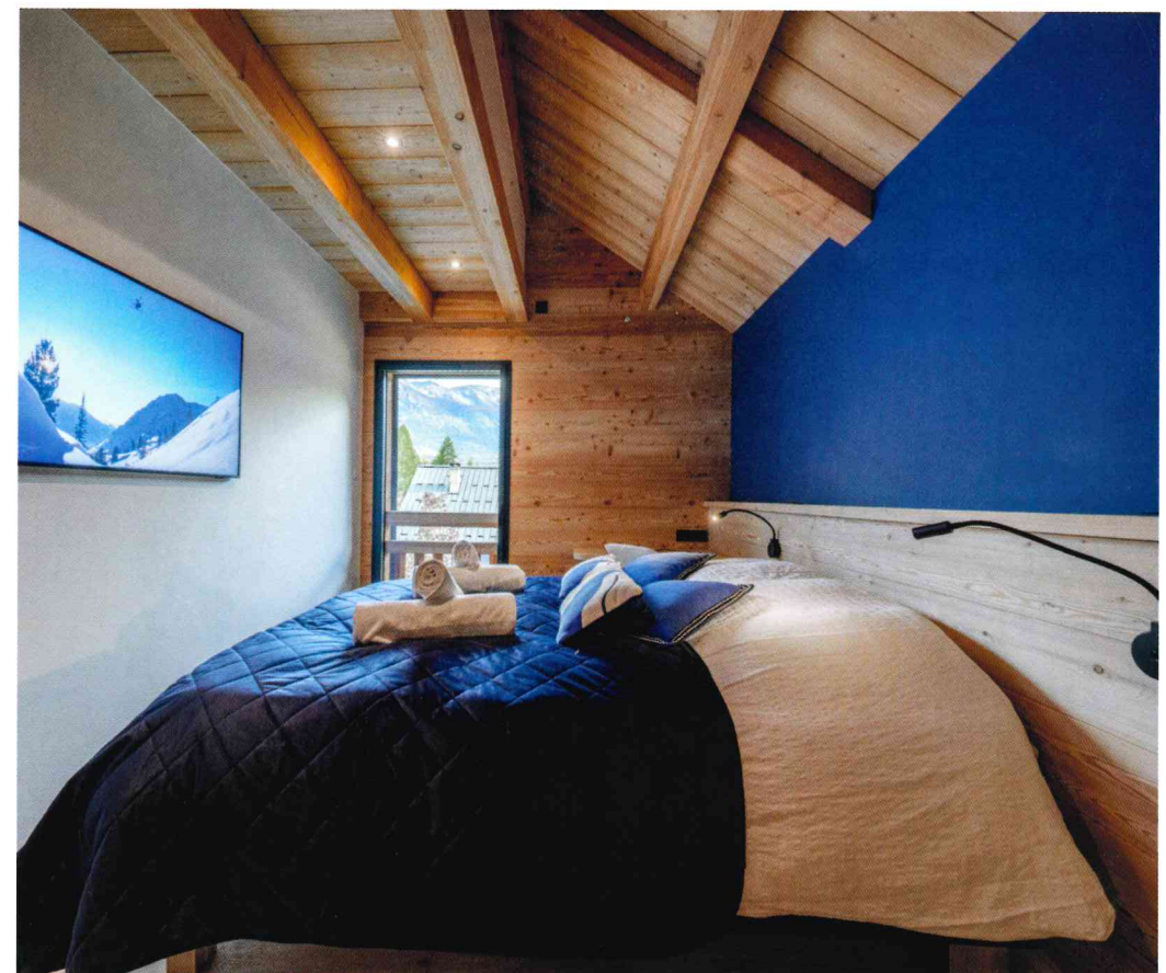
Ci-dessus : L'isolation des murs combine laine de verre et mousse polyuréthane pour garantir un confort thermique optimal toute l'année.